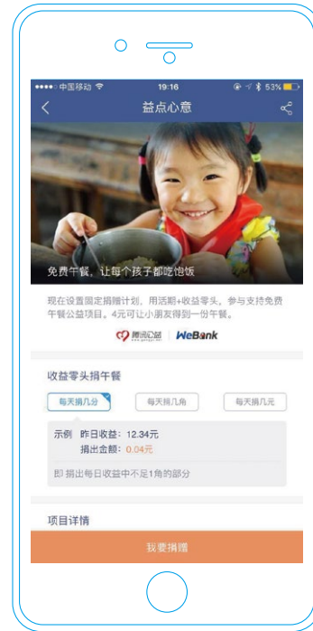
微众银行“壹点心意”公益项目

我们利用自身创新优势，在微众银行App中创新推出了公益项目“益点心意”，参与者可以设置固定捐赠计划将“活期+”收益的零头捐赠给免费午餐基金，为贫困地区的孩子提供有营养的午餐，该项活动在短短数月内，已为513所学校的孩子们提供了40,385份午餐，被当地群众和舆论称为“爱心小精灵”。本行还积极参与扶贫帮困等形式多样的社会服务活动，打造了“We爱”系列爱心公益活动。2016年9月，本行“We爱”爱心公益小组组织团员前往汕尾后洪小学捐助爱心图书室及运动器材，与后洪小学的学生互动交流，探访重点资助的两个贫困学生家庭，开始了爱心公益活动的有益尝试。